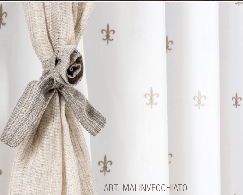
ART. MAI INVECCHIATO