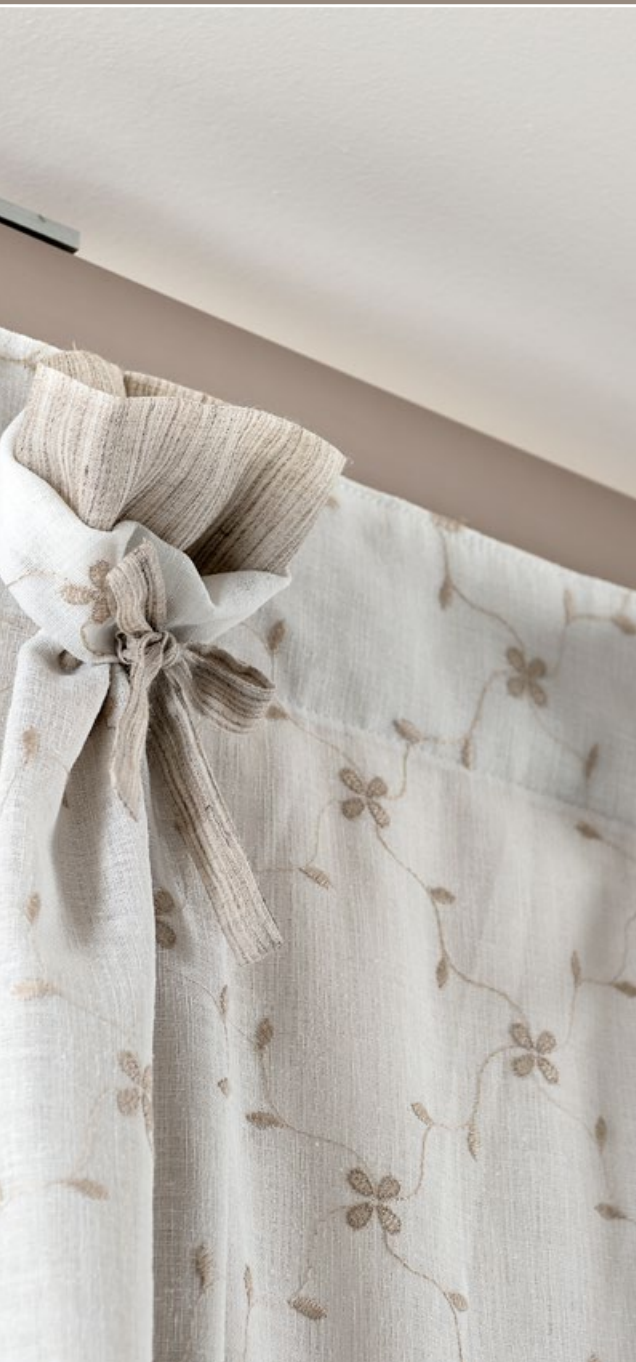
PETALI RICAMO CINIGLIA